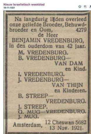
Nieuw Israelitisch Weekblad 18 november 1921