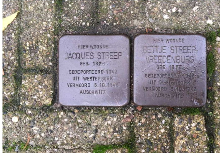
Hoge Laarderweg 137 Hilversum

zusters is dat met de toevoeging 'en Kind' wel het geval. Jacques en Bettje werden beiden ook slachtoffer van het nazi-regime en kwamen op 5 oktober 1942 om in Auschwitz. In januari 1942 hebben ze nog op de Hoge Laarderweg 137 in Hilversum gewoond. Twee stolpersteinen herdenken hen in hun namen.