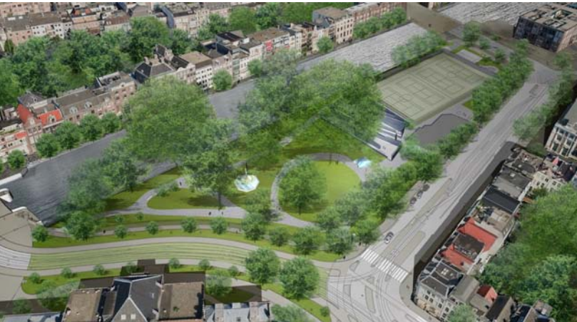
Vogelvlucht afbeelding van het Wertheimpark met daarin de situering van het Spiegelmonument en het Namenmonument

In de eerste plaats: er is al een namenwand, in de Hollandsche Schouwburg, een indrukwekkend monument met alle familienamen van vanuit Nederland vermoorde Joden. Het was begrijpelijk dat het Joods Historisch Museum, dat de schouwburg beheert, aanvankelijk bezwaren had tegen nog een namenwand, nu met alle individuele namen. Maar de directie van het museum is intussen van mening veranderd. In de eerste plaats is er intussen een Joods Cultureel Kwartier gevormd, waar het museum, de schouwburg, de Portugese Synagoge, een nog nieuw in te richten Sjoamuseum in de Kweekschool tegenover de schouwburg en het Auschwitz Monument van Jan Wolkers deel van uitmaken. Een Namenwand past daar zeer goed bij, op de plek waar vroeger de meeste Amsterdamse Joden leefden. Maar er is nog een argument. De namenwand in de Hollandsche Schouwburg met de familienamen is belangrijk voor bezoekers, bijvoorbeeld uit het buitenland, die daar wellicht ook hun eigen familienaam kunnen vinden, maar de individuele namenwand is niet hetzelfde.