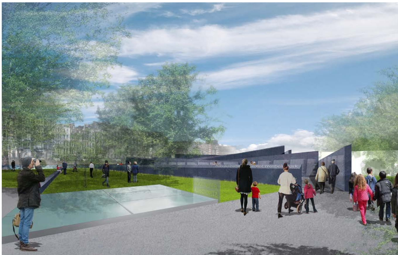
Artist impression van de ingang van het Namenmonument