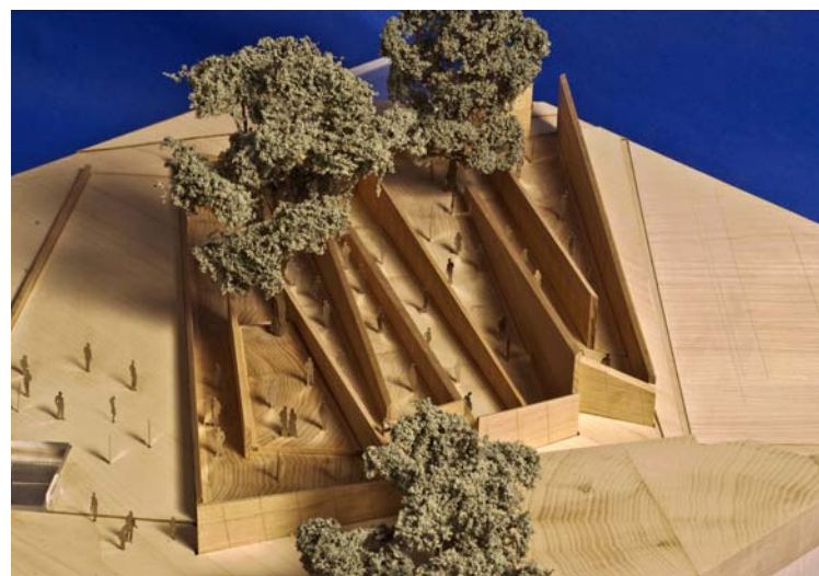
Bovenaanzicht van de maquette van het Namenmonument